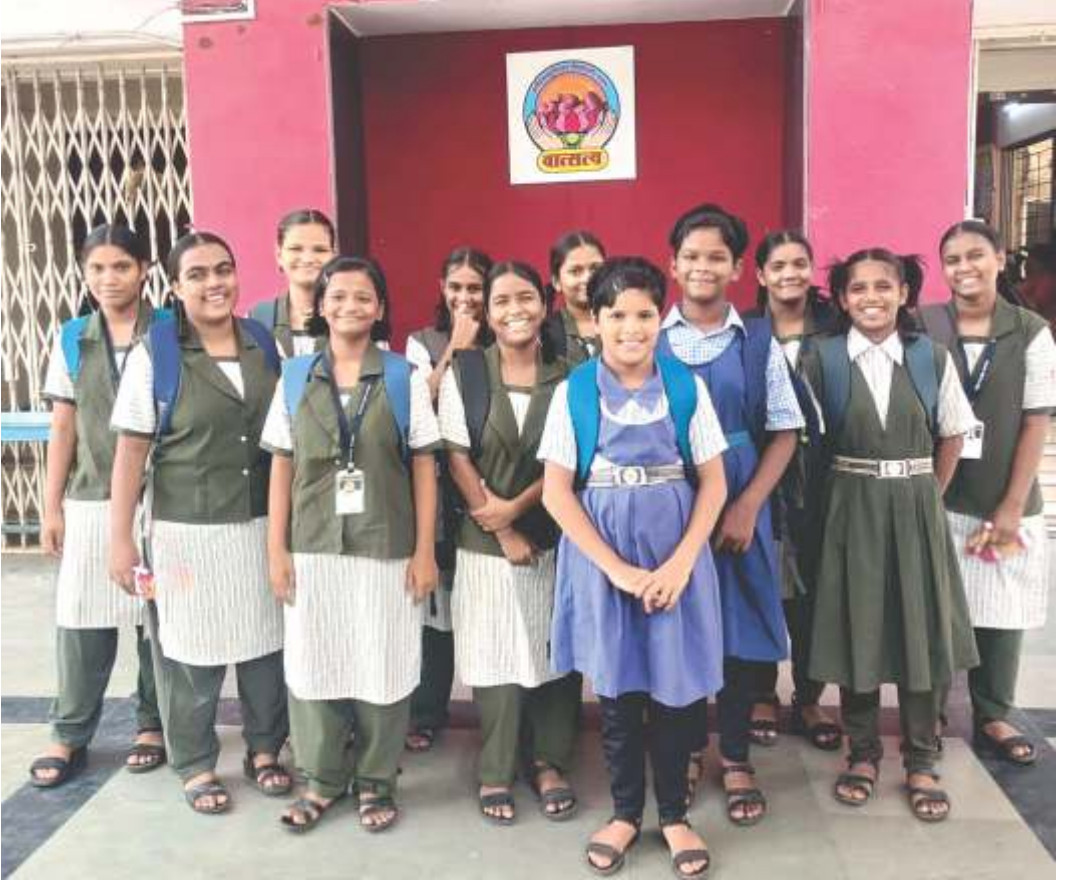
Girl's of Balikashram at Sanpada going to School