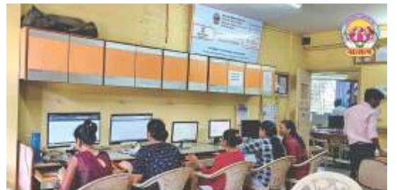
Keen learners at E-Vidya Class at Vatsalya.