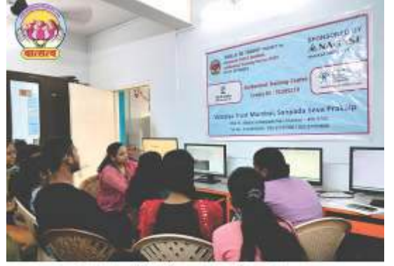
Outstation Digital learners are all eyes & ears.

छोट्या शहरात आणि खेडेगावांत संगणक साक्षरतेचा प्रसार करण्याचे कार्य सदर प्रकल्पातर्फे करण्यात येते.